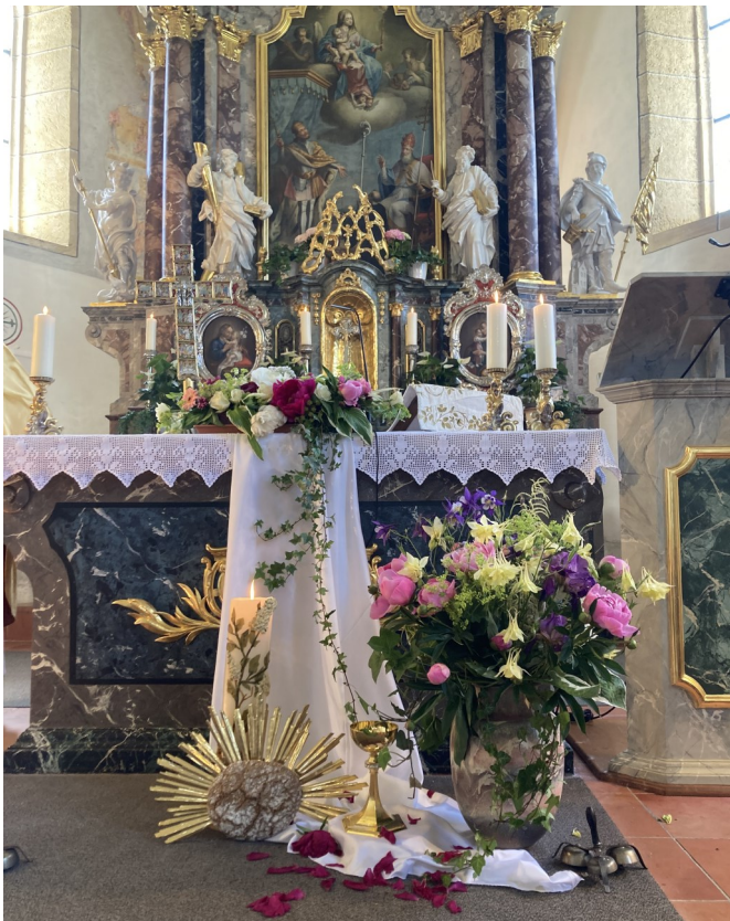
Fronleichnam in St. Oswald